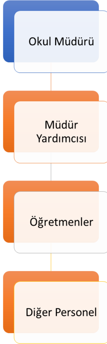
Atatürk İlkokulu Teşkilat Şeması

27.06.2019 tarih ve 30814 sayılı Resmi Gazetede yayınlanan Milli Eğitim Bakanlığına bağlı Eğitim Kurumları Yönetici ve Öğretmenlerinin norm kadrolarına ilişkin yönetmelik doğrultusunda oluşturulmuştur.